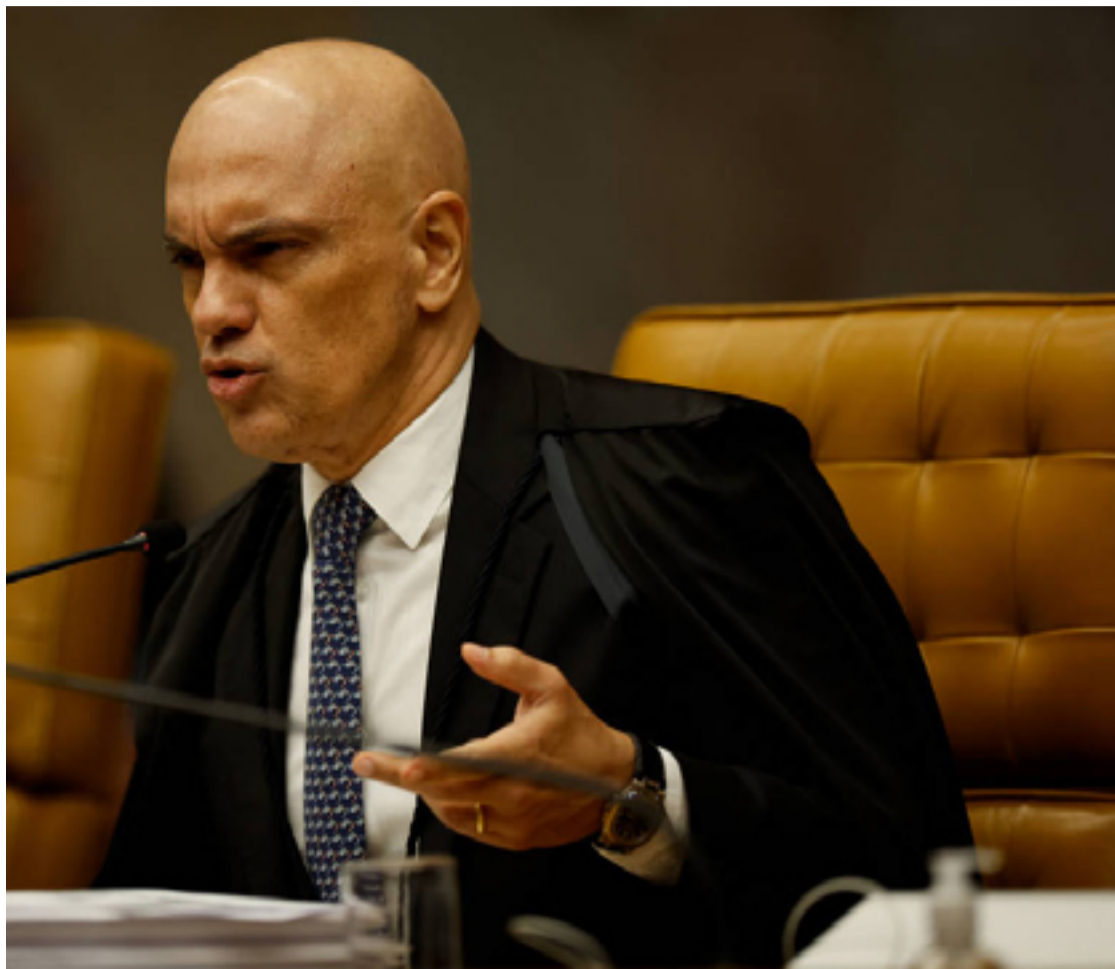
Alexandre de Moraes: decisão polêmica sobre bloqueio no Brasil da rede social X

Moraes justificou a mudança na ordem alegando que o próprio X poderia atender a