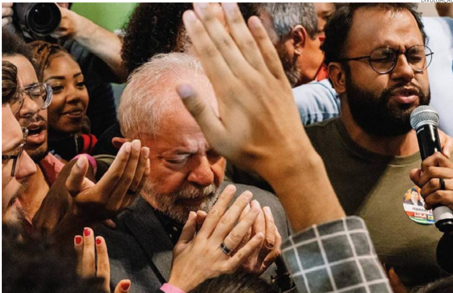
Lula acena para eleitores evangélicos em cena do doc 'Apocalipse nos Trópicos', lançado durante Festival de Cinema de Veneza

Em seu filme, Costa trata inclusive de um esforço de lideranças americanas de implementar o evangelismo no Brasil. "Claro que o movimento evangélico brasileiro tem elementos originais, mas houve esforços durante a Guerra Fria de mandar missionários ao Brasil com