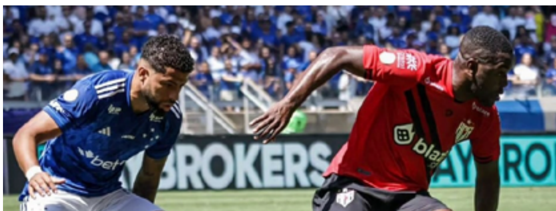
Dragão perdeu de 3 a 1 para Cruzeiro ontem no Mineirão

A próxima rodada terá jogo do Atlético-GO contra o Vitória, em Goiânia, mas longe: só no dia 14. O Cruzeiro pegará o São Paulo, no Mineirão, no dia 15.