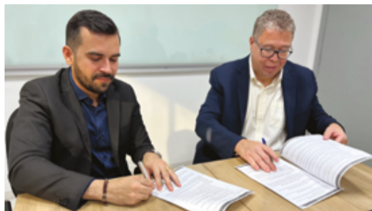
Parceria disponibiliza espaço adequado, na FAMA, para atividades do NAF

O NAF é direcionado a uma ampla gama de público, incluindo pessoas físicas de baixa renda que precisam de orientação sobre questões fiscais e tributárias, microempreendedores individuais (MEI) que desejam regularizar suas situações fiscais, organizações da sociedade civil (OSC) em busca de orientação contábil, e pequenos proprietários rurais que necessitam de assistência fiscal. A iniciativa é uma maneira de integrar a comunidade à cultura de cidadania fiscal, promovendo a regularização de obrigações e fortalecendo a inclusão social.