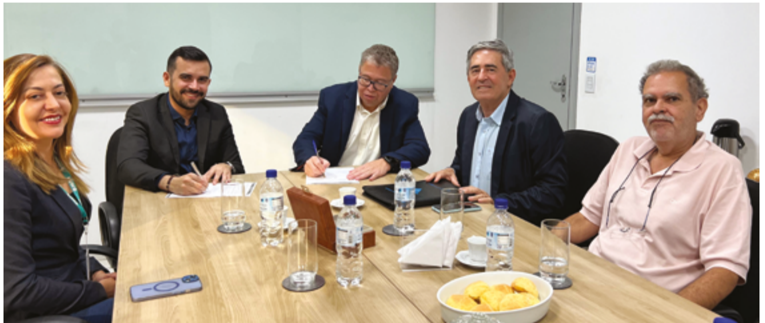
Reunião em que foi firmada a parceria FAMA- Receita Federal do Brasil (RFB); benefício é destinado para os alunos e para a comunidade em geral

A FAMA, em parceria com a Receita Federal, disponibilizará um espaço adequado para a realização das atividades do NAF, equipado com mobiliário e tecnologia necessários para um atendimento de qualidade. Professores especializados supervisionarão os alunos da instituição, que terão a oportunidade de aplicar na prática os conhecimentos adquiridos em sala de aula e nas capacitações fornecidas pela Receita Federal. Essa abordagem prática não só